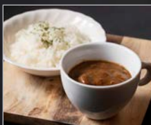
② 「焼酎の里 霧島ファクトリーガーデン」 特製ブラックカレー