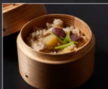
① 鶏とさつまいもの炊き込みご飯